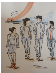
Illustration 9: A.Roy Développer la capacité de sortir de soi pour aller vers l'autre

Plus concrètement, cette approche de la création nous invite à deux choses.