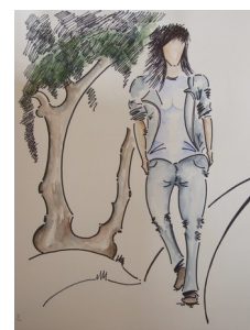
Illustration 8: A.Roy Nous sommes invités à une conversion : d'abord "aller vers soi"