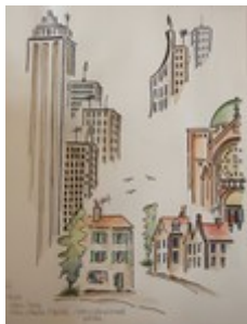
Illustration 5: A.Roy "Par l'habitat, être acteur sur le plan local"

En fait quand on parcourt l'encyclique, il apparaît assez clairement que, quand le Pape nous dit que nous avons besoin d'une conversion, il nous invite globalement à « changer de regard ». Il nous invite, pour répondre au défi pastoral, à changer nos lunettes, à modifier nos filtres dans