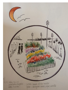
Illustration 6: A.Roy. Le pape nous invite "à cultiver et à garder" le jardin du monde

« Quelles tâches sommes nous prêt, nous ici et maintenant, à accomplir en commun, à porter ensemble, pour faire en sorte que notre terre soit une véritable œuvre où chacun et chacune a sa place, sans négliger les jeux de pouvoirs, les conflits d'intérêts, etc. dans la gestion des ressources humaines et naturelles ? »