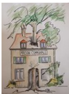
Illustration 1: A.Roy - Regardons ce qui se passe dans notre maison commune...

Après avoir échangé sur les thèmes de la solitude, de la mendicité-fraternité, de la communication entre les générations, et du dialogue avec nos frères et soeurs musulmans, l'équipe des dimanches de PELL'VOISINS, s'est penchée sur les questions d'environnement à travers le document écrit par le Pape François.