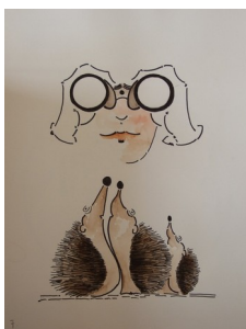
Illustration 7: A.Roy. "Une invitation à nous décentrer... l'homme et la femme ne sont pas au centre de l'univers"

Pour le pape François, ceci a deux conséquences :